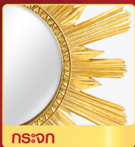
สีรองพื้นอะคริลิกทองคำ สูตรน้ำมัน