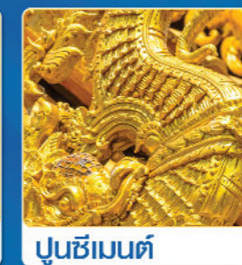
สีทองพื้นอะคริลิก สูตรน้ำ