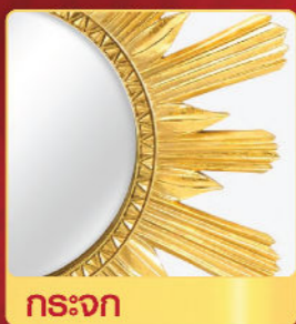
สีทองพื้นอะคริลิกทองคำ สูตรน้ำมัน