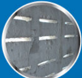
ฟิล์มสีโป่งพอง (Blistering)