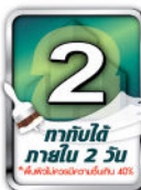
ทาสีได้ภายใน 2 วัน

สำหรับทาภายนอก/ภายใน ทั้งปูนใหม่และปูนเก่า