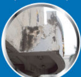
เชื้อราและตะไคร่น้ำ (Fungi and Algae)