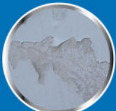
ฟิล์มสีลอกหลุด (Peeling)