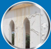
คราบเกลือ หรือ คราบขาวบนฟิล์มสี (Efflorescence)

ป้องกันได้โดย... กัปตัน เพอร์เฟ็กซ์ ไพร์เมอร์