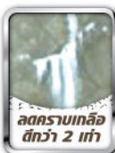
ลดคราบเกลือ ดีกว่า 2 เท่า